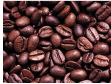
Gambar 2. Hasil roasting biji kopi

Berdasarkan hasil kajian literatur yang telah dilakukan, proses roasting terbukti memberikan pengaruh yang sangat signifikan terhadap perubahan fisik dan kimia biji kopi, terutama kopi robusta yang menjadi fokus utama pembahasan. Roasting menyebabkan terjadinya reaksi kimia kompleks seperti Maillard, karamelisasi, dan pirolisis yang berperan dalam pembentukan aroma dan cita rasa khas kopi. Perubahan ini juga disertai penurunan kadar air, peningkatan volume, serta penurunan massa jenis akibat terbentuknya struktur pori yang lebih besar. Berdasarkan jurnal yang saya baca dari (Batubara dkk., 2024) kopi robusta menunjukkan pola perubahan yang lebih konsisten dibandingkan jenis kopi lainnya, sehingga parameter suhu dan waktu lebih mudah dikontrol. Stabilitas ini menjadikan robusta sangat cocok untuk diuji pada mesin roasting tipe hot air . Respons fisik-kimia yang lebih mudah diprediksi memberikan peluang untuk menghasilkan mutu kopi yang seragam.