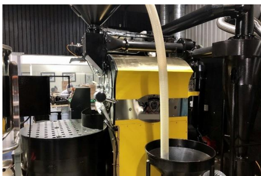
Gambar 3. Mesin roasting tipe hot air

Dalam konteks robusta, komposisi kimia seperti gula, protein, dan senyawa prekursor aroma cenderung lebih stabil terhadap perubahan panas. Konsistensi ini memperkuat temuan bahwa robusta lebih cocok untuk proses roasting bersuhu tinggi menggunakan mesin tipe hot air . Dengan demikian, pemahaman mengenai parameter kimia menjadi faktor kunci dalam menentukan kualitas akhir kopi sangrai.